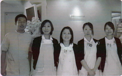
2008年12月に開院。現在、歯科医師1名、歯科衛生士4名のメンバーで日々診療を行っている。